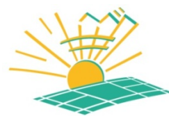
SAS Badminton SANILHAC 24